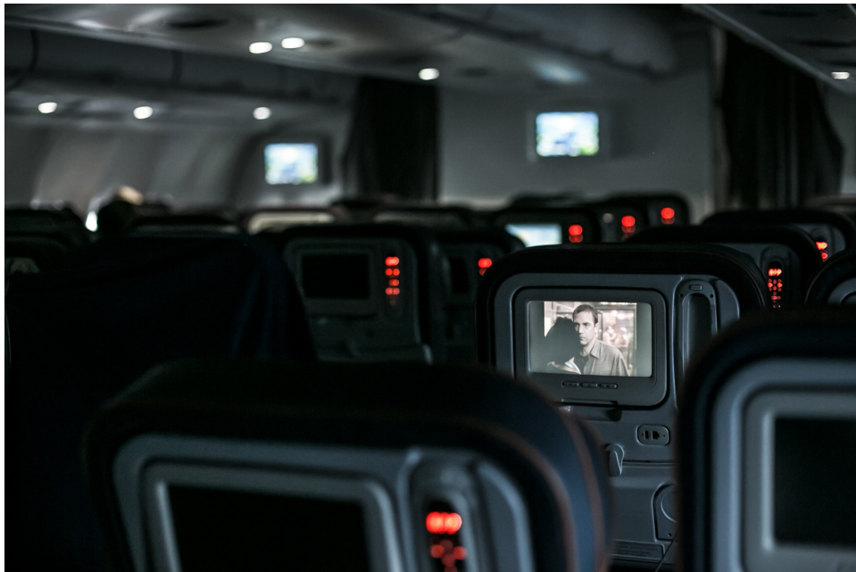
Filmübertragung in einem Passagierflugzeug

Der Beitrag stellt die Entwicklungen zur Öffentlichen Wiedergabe anhand der ergangenen europäischen und nationalen Entscheidungen der letzten Monate dar.